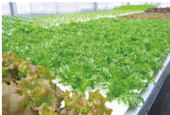
定番の畑やプランターで…