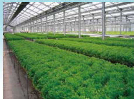
水耕栽培でも人気上昇中