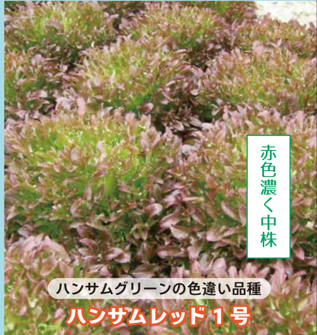
ハンサムグリーン